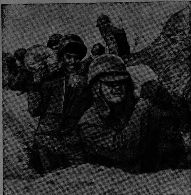
Soldados de la Infantería de las Naciones Unidas cargan sacos de arena para reforzar sus posiciones antes de comenzar el mayor ataque aliado de este año en contra de los comunistas chinos atrinchados en la Colina de la T, en la Corea. Las tropas de las Naciones Unidas fueron detenidas por el fuego cruzado del enemigo, a sólo 15 yardas de su objetivo.